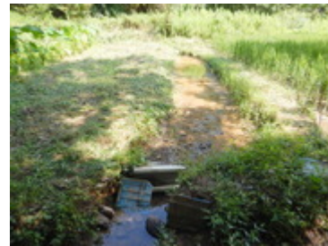
大雨で池が埋まる(9/15)