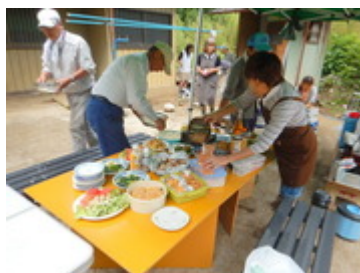
殿山共同農場と交流 (6/6)