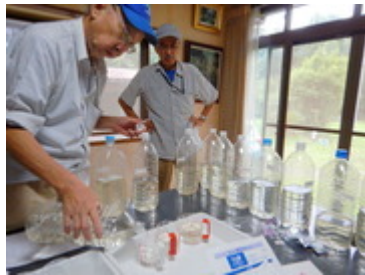
溜池と水路の水質調査 (8/21)