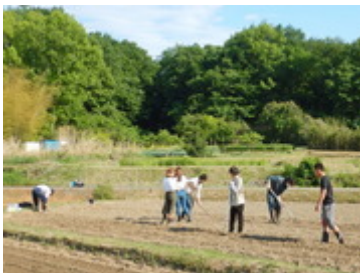
青木ノ入畑種まき (5/7)