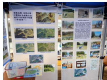
環境みらいフェア(10/10)