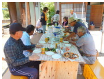
殿山共同農場との交流 (7/11)