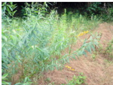
緑肥クロタリアア開花(9/24)