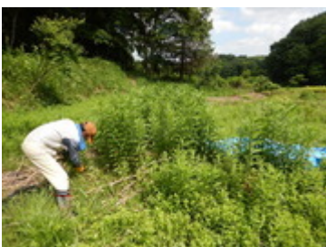
学生ボランティア参加 (6/29)