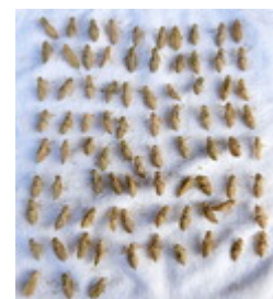
ウスバキトンボ羽化 (7/31)